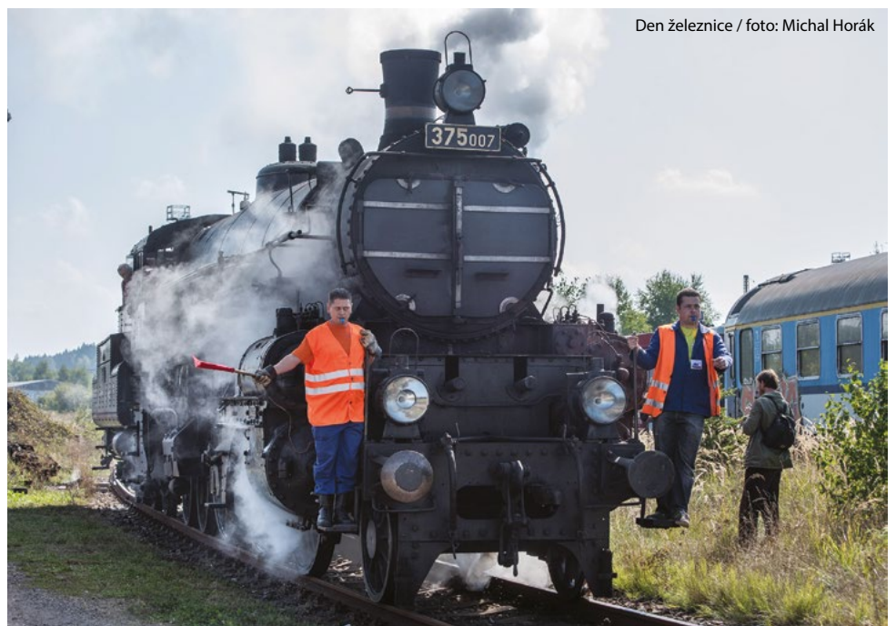
Den železnice