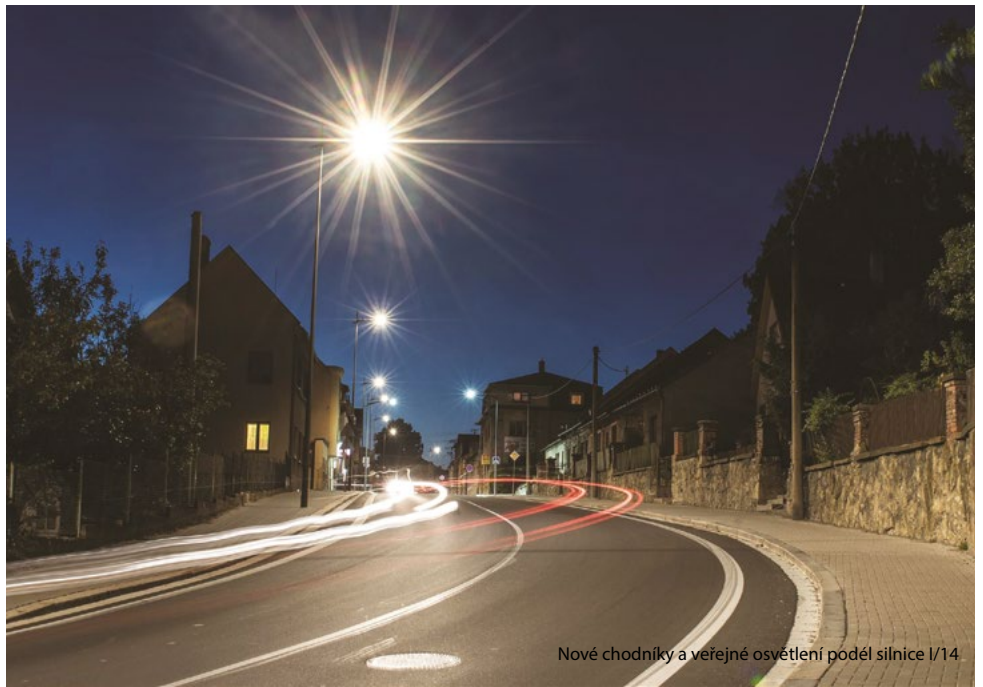
Nové chodníky a veřejné osvětlení podél silnice I/14

Jiří Smrčka, vedoucí odboru majetku města