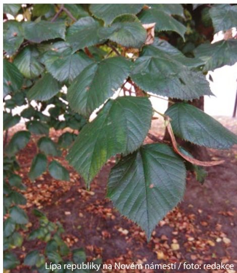
Lípa republiky na Novém náměstí