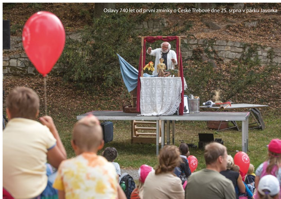
Oslavy 740 let od první zmínky o České Třebové dne 25. srpna v parku Javorka

Uzávěrka příštího čísla je 15. října. Příspěvky, fotografie, podklady pro inzerci i pozvánky na akce pošlete na e-mail redakce@ceska-trebova.cz . Při problémech s distribucí Českotřebovských novin se obraťte na redakci. Více informací na www.ceskotrebovskenoviny.cz .