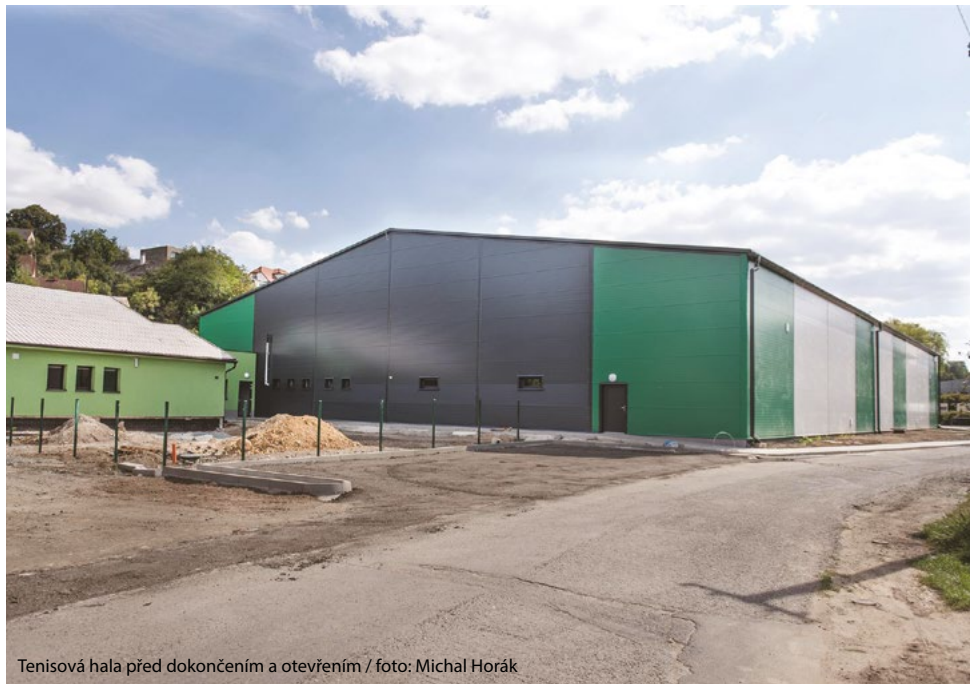
Tenisová hala před dokončením a otevřením