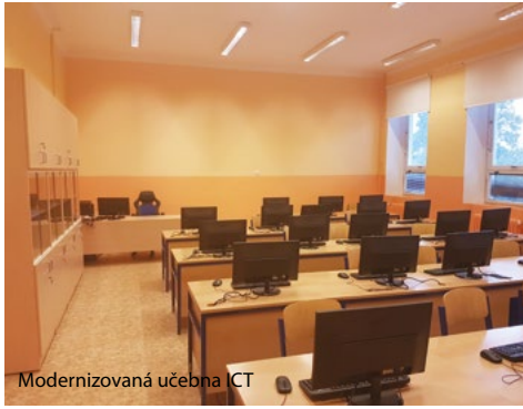
Modernizovaná učebna ICT