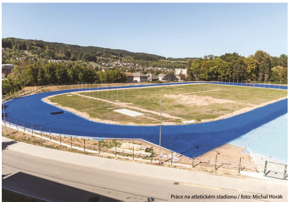
Práce na atletickém stadionu