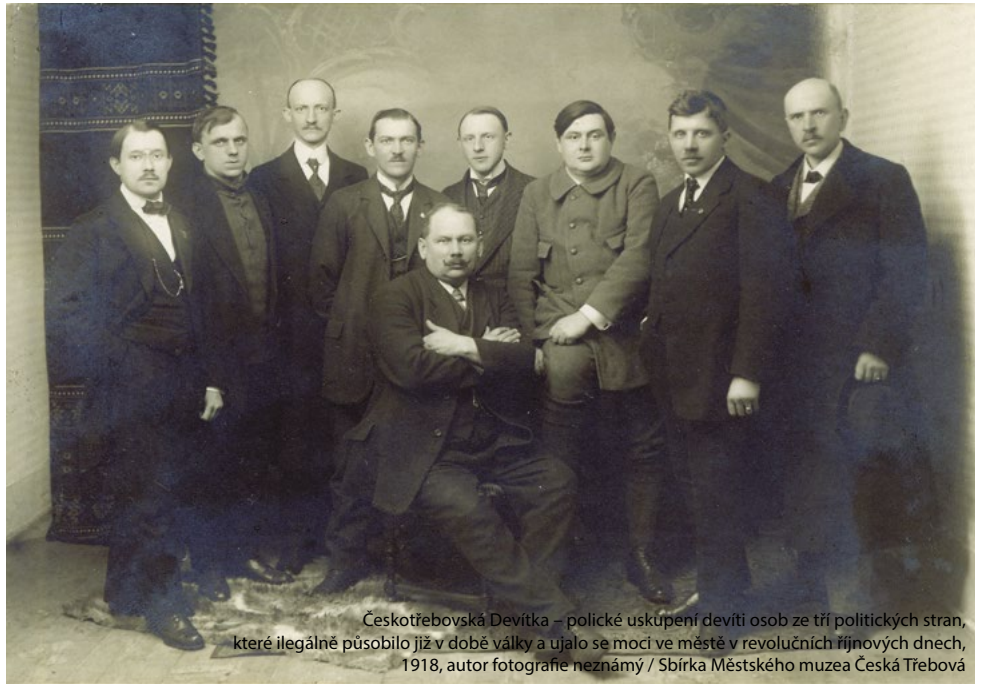
Českotřebovská Devítka – polické uskupení devíti osob ze tří politických stran, které ilegálně působil již v době války a ujalo se moci ve městě v revolučních říjnových dnech, 1918

Na schůzi o den později padl další návrh na sestavení národní obrany. Ta by se skládala ze cvičených vojinů a Sokolstva, včetně tělocvičné jednoty sociálních demokratů. Výcvik Sokolstva měl převzít por. Mašíček. Návrh byl schválen a vyhláška okamžitě vybubnována a uveřejněna 16 . MNV se dále rozhodl prostřednictvím prof. Šloula informovat o svých krocích Prahu.