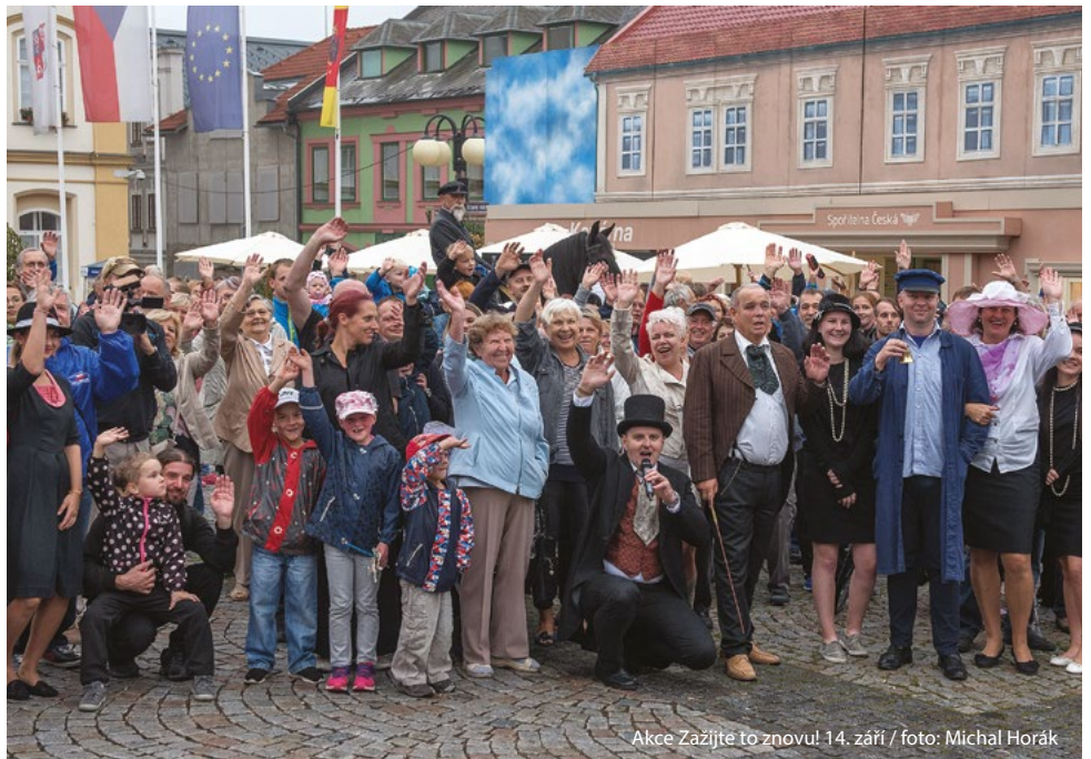
Akce Zažijte to znovu! 14. září

Fišar Jiří 1. 10. 1923 Parník Janderová Věra 7. 10. 1923 Česká Třebová Rejmanová Eliška 21. 10. 1923 Česká Třebová Martinková Marta 29. 10. 1923 Česká Třebová