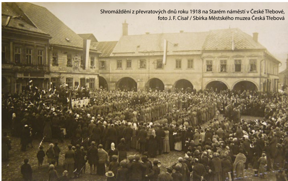
Shromáždění z převratových dnů roku 1918 na Starém náměstí v České Třebové