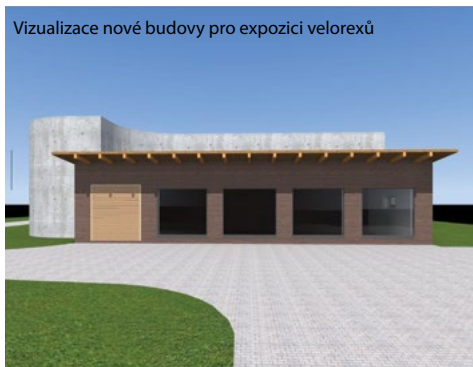
Vizualizace nové budovy pro expozici velorexů

Informace o akcích Městského muzea Česká Třebová naleznete i na webových stránkách muzea www.mmct.cz a na facebooku https://www.facebook.com/mmctcz .