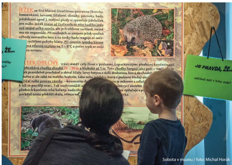
Sobota v muzeu