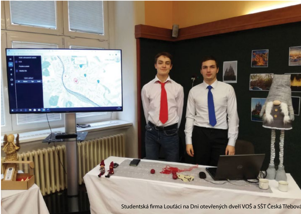
Studentská firma Louťáci na Dni otevřených dveří VOŠ a SŠT Česká Třebová