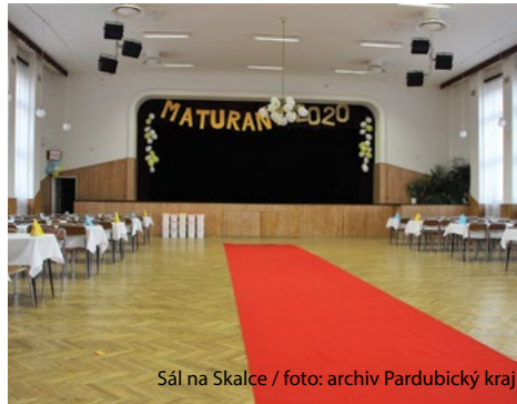
Sál na Skalce

Českotřebovský zpravodaj www.ceskotrebovskyzpravodaj.cz