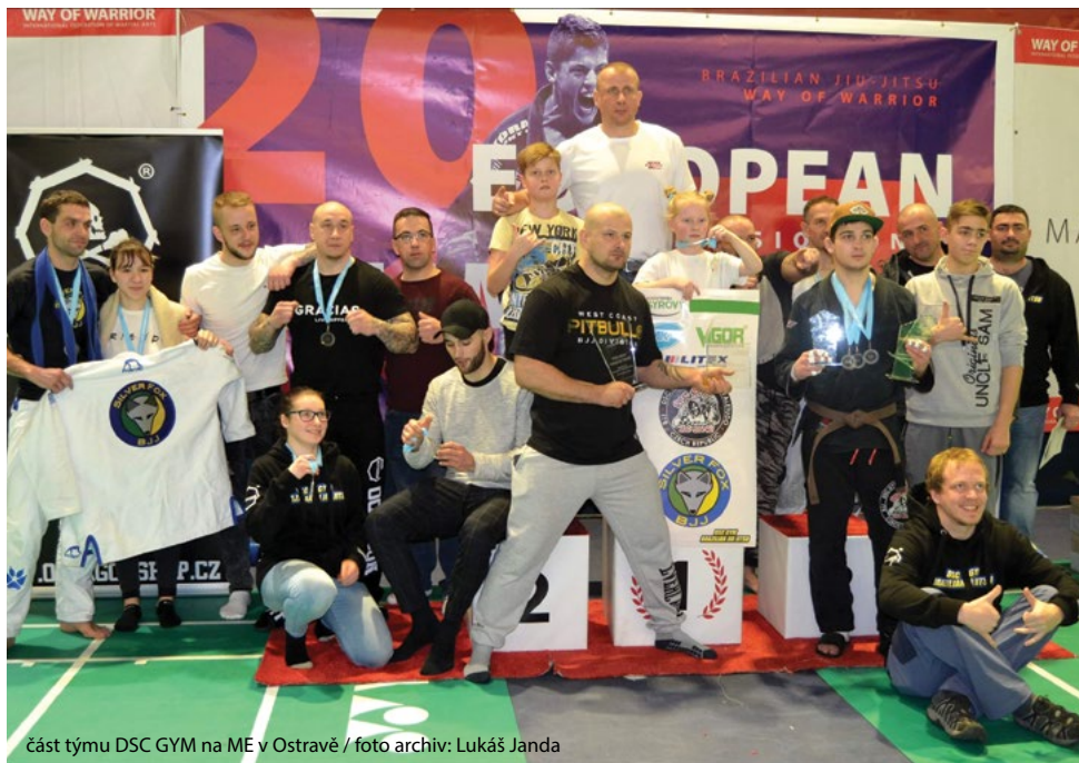
část týmu DSC GYM na ME v Ostravě