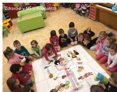
Zdravá 5 v MŠ U Koupaliště