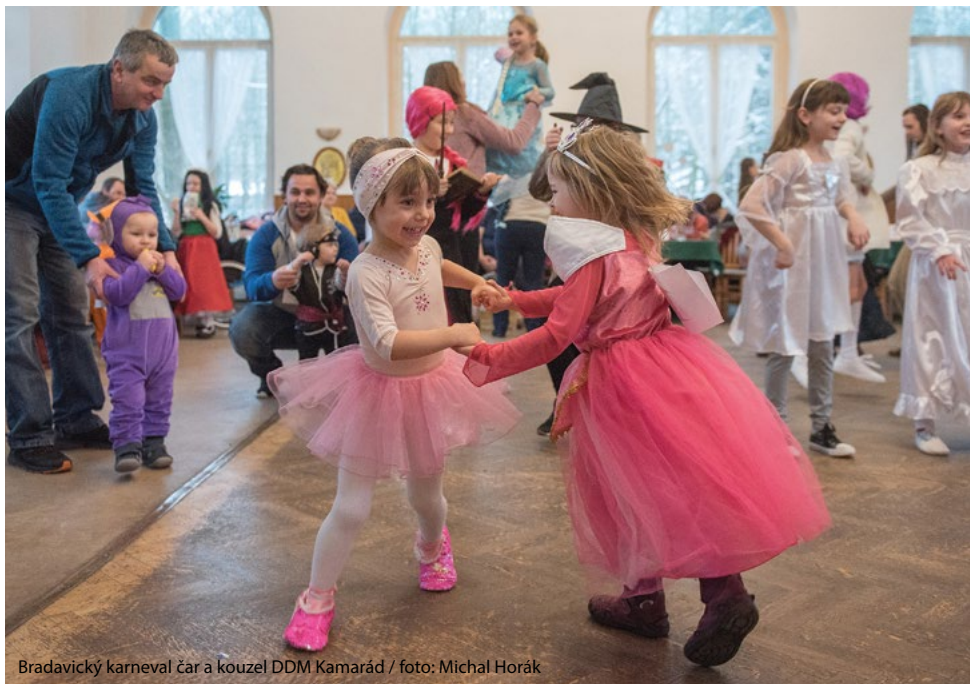
Bradavický karneval čar a kouzel DDM Kamarád