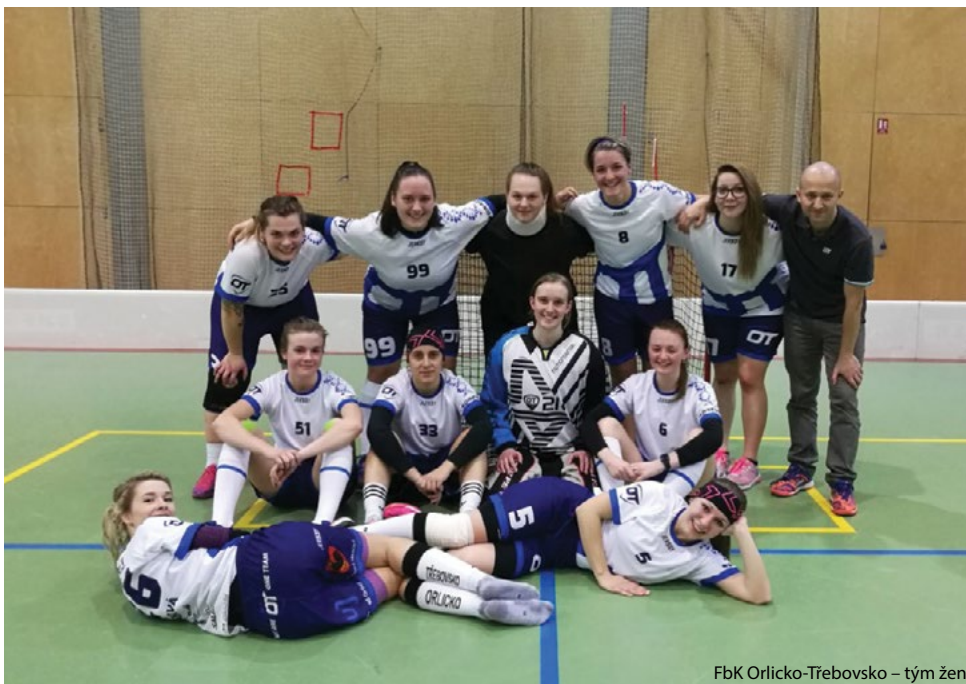
FbK Orlicko-Třebovsko – tým žen