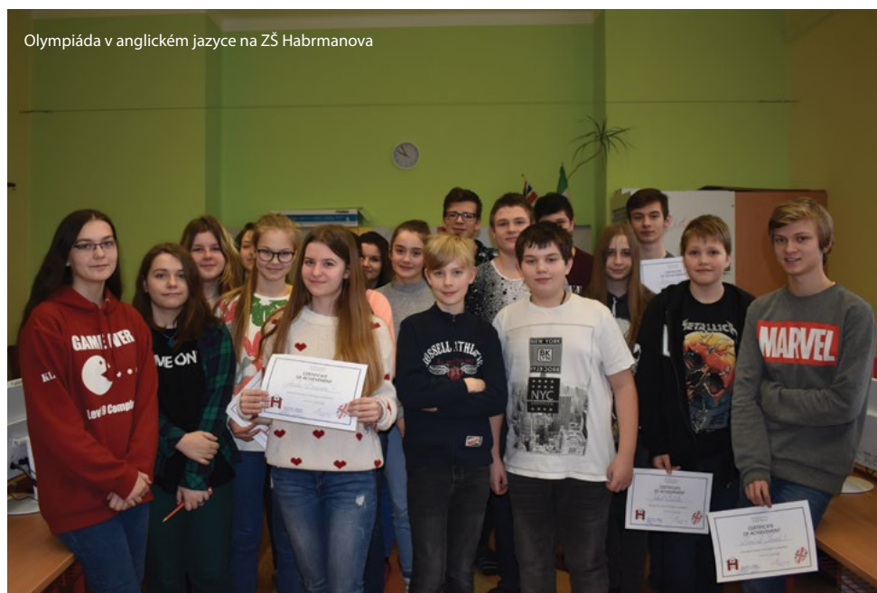
Olympiáda v anglickém jazyce na ZŠ Habrmanova