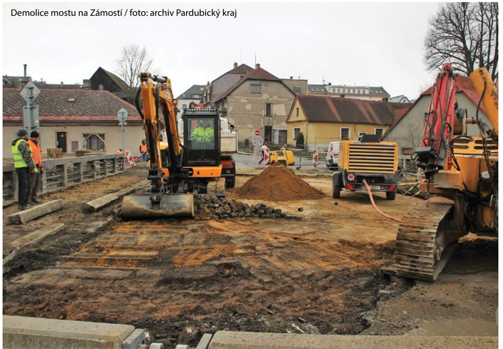
Demolice mostu na Záměstí

Českotřebovský zpravodaj www.ceskotreboskyzpravodaj.cz