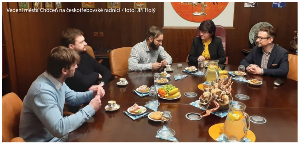
Vedení města Choceň na českotřebovské radnici